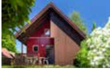
Chalet 4 Personen Klassisch 2 Schlafzimmer 30 m 2