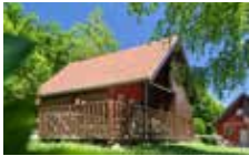
Chalet 6 Personen 3 Schlafzimmer 42 m 2

Gruppe Chalet mit 4 Schlafzimmer, Esszimmer bis 20 Personen und 10 Personen schlafen