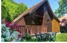
Chalet 5 Personen Komfort 3 Schlafzimmer 35 m 2