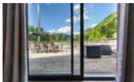
Gite du Hohneck, Wohnung mit 3 Doppelzimmer, 2 Badezimmer, Einbauküche und Esszimmer für 18 Personen

Verfügbarkeit und Preise auf unserer Website