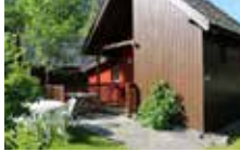
Chalet für rollstuhl eingrichtet 4 Personen