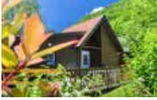
Chalet 4 Personen Komfort 2 Schlafzimmer 35 m 2