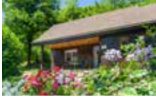
Chalet 2 Personen 1 Schlafzimmer 25 m 2