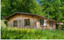
Chalet Ours 2 Personen 1 Schlafzimmer 40 m 2